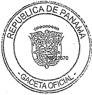
JUAN CARLOS VARELA R. Presidente de la República